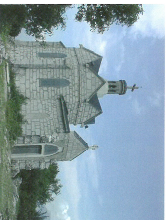
Chapelle du Mont St-Michel